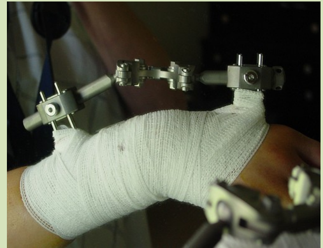
فیکساتور خارجی میچ دست

این وسیله در شکستگیهای خرد شده ضمن حمایت از قطعات شکستگی، امکان درمان فعال بافت نرم آسیب دیده را فراهم می کند.